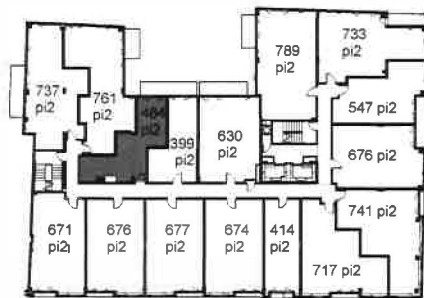
RUE SAINTE CATHERINE EST

1255, rue de Bullion #314, 414, 514, 614, 714, 814, 914 1 ½ (Studio) 484 pi 2 (sq.ft.)