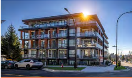
Axir North Vancouver (C.-B.)