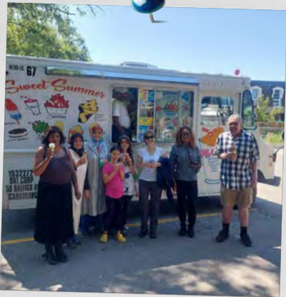
Maisons mitoyennes de Bloor Street East Mississauga (Ontario)

Cet été, nos communautés CAPREIT à travers le Canada ont pris vie avec un éventail dynamique d'événements et d'activités, favorisant les liens et créant des expériences mémorables pour nos locataires. Des barbecues animés en plein air aux journées amusantes en famille, chaque propriété a organisé des événements uniques qui ont rassemblé les voisins et célébré la saison.