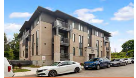
Hillview Ottawa (Ontario)