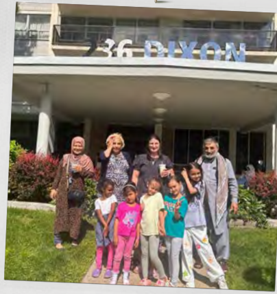
Dixon Appartements Etobicoke (Ontario)