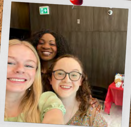
The View Edmonton, Alberta