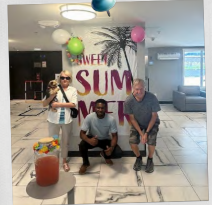
Pointe Lakeview West Kelowna (Colombie-Britannique)

Cet été, nos communautés CAPREIT à travers le Canada ont pris vie avec un éventail dynamique d'événements et d'activités, favorisant les liens et créant des expériences mémorables pour nos locataires. Des barbecues animés en plein air aux journées amusantes en famille, chaque propriété a organisé des événements uniques qui ont rassemblé les voisins et célébré la saison.