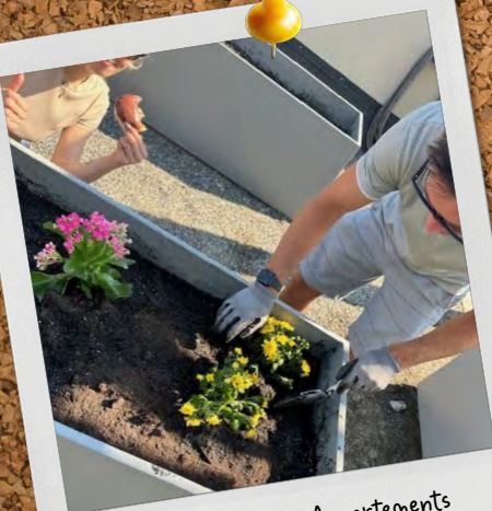
Proxima Kelowna Appartements Kelowna (Colombie-Britannique)