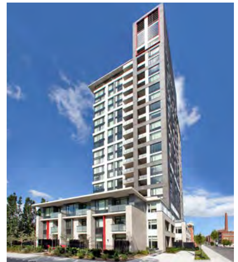
Nuovo Ottawa (Ontario)

Nous sommes ravis d'accueillir plusieurs nouvelles communautés au sein de notre famille CAPREIT! Au cours des derniers mois, CAPREIT a élargi son portefeuille avec l'acquisition de six immeubles locatifs exceptionnels à travers le Canada.