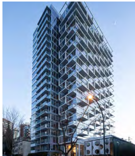
The Pendrell Vancouver (C.-B.)