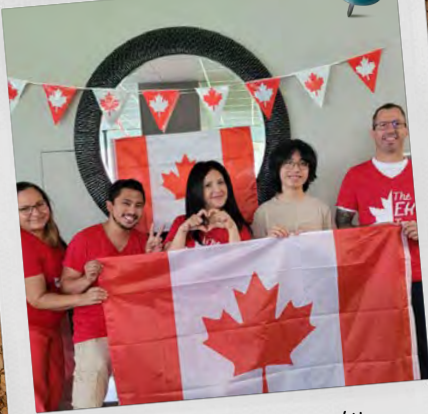
Appartements Park Royal Village Mississauga (Ontario)