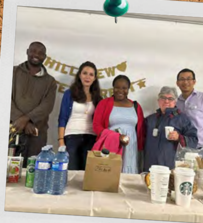
Appartements Hillview Orléans (Ontario)