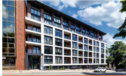
Grafton Park Halifax, (Nouvelle-Écosse)