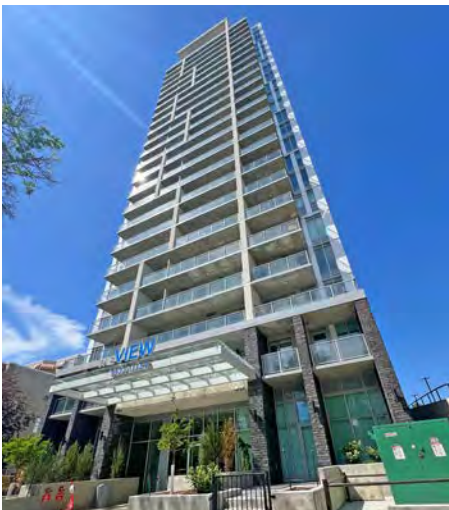
The View Edmonton (Alberta)